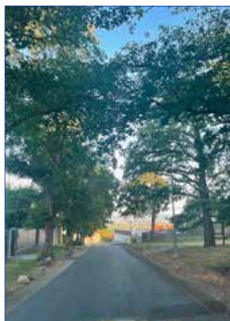
Ulice Lesní po rekonstrukci.