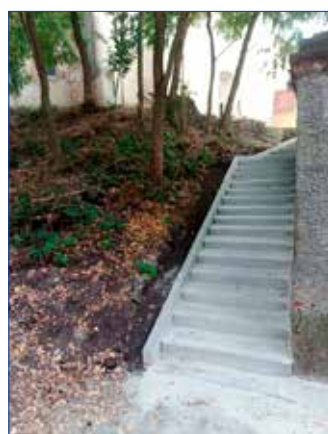
Nové schody u Vísecké školy.