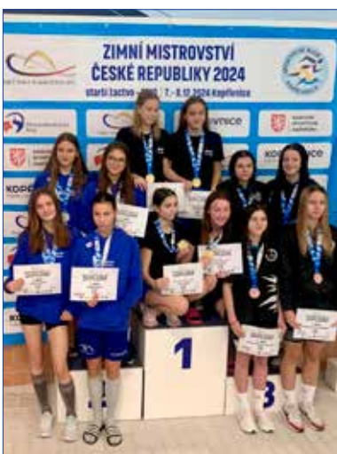
Výprava hořovických plavců