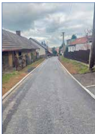
Opravená ulice Vísecká.