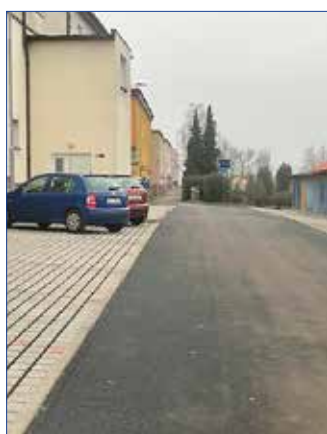
Ulice 1. Máje po rekonstrukci.