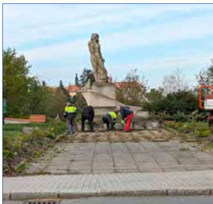
Úprava prostoru před sochou Obětovaného.