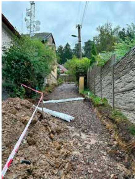
Ulice Malá před rekonstrukcí a po ní.

A teď to, co nás trápí a upřímně – s čím nám i Vy můžete pomoci. Zlobili jste se na nás za zvýšení poplatků za odvoz odpadů. Vybrali jsme celkem 5,5 mil. Kč. Již k dnešku jsme z městského rozpočtu doplatili na svoz odpadu více než 18 milionů Kč. Kde je příčina? Nejen v nastavených cenách svozové společnosti AVE CZ odpadové hospodářství s.r.o., o kterých jednáme, ale i v nás samotných. Jen málo lidí odpad třídí a ostatní vše dávají do směšného odpadu – čili do černé popelnice či černých kontejnerů. Zatímco za tříděný odpad město něco málo inkasuje, na směšný odpad neúnosně doplácíme. Navíc někteří občané naplní více popelnic, než za kolik zaplatili, a využívají je i k odstranění odpadu, který má být tříděn a dokonce i takového, který patří do sběrného dvora. Proto uvažujeme o čipování a vážení nádob, abychom tomuto jevu zamezili, a rovněž bychom v nejbližší době rádi zavedli systém odvozu odpadu door to door, což znamená, že v rodinných domech budou k dispozici sběrné