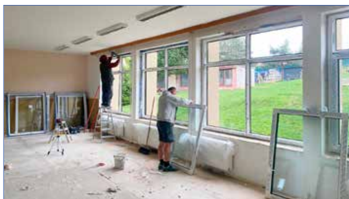
MŠ Jiráskova - po 40 letech výměna oken ve 4. pavilonu